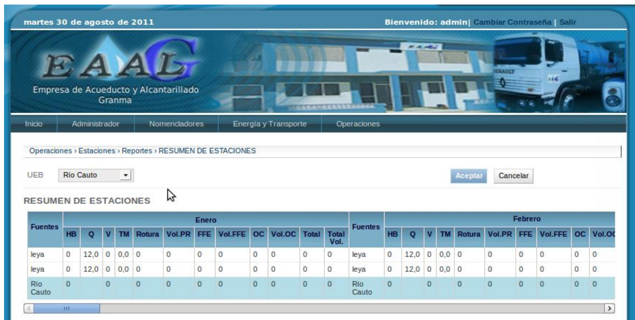
Figura 4: Reporte Resumen de estaciones