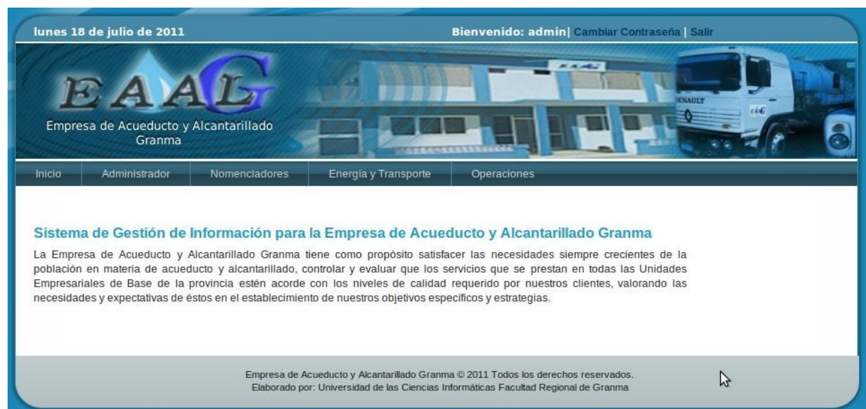
Figura 2: Página de inicio del sistema.